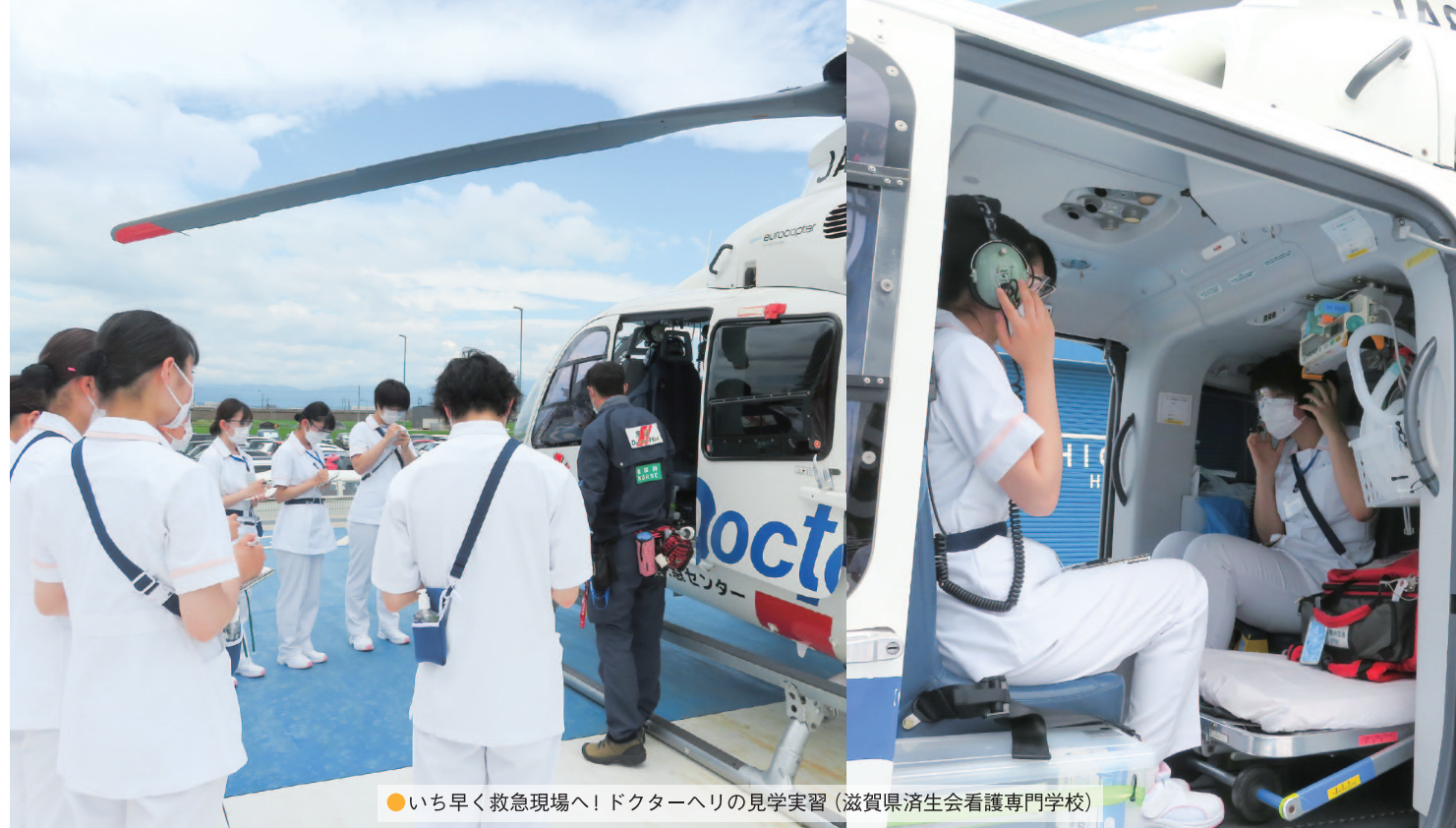
●いち早く救急現場へ！ドクターヘリの見学実習（滋賀県済生会看護専門学校）