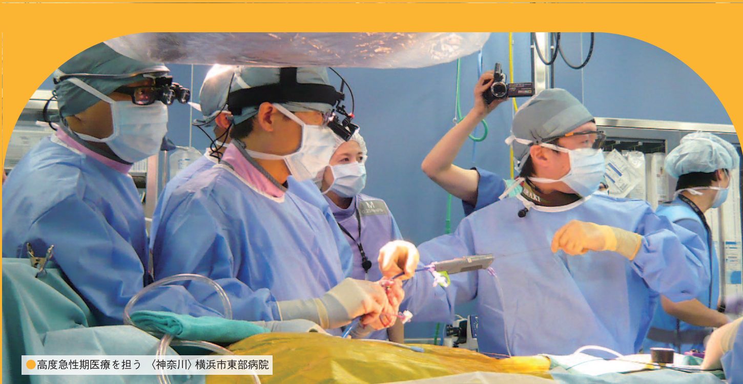
●高度急性期医療を担う〈神奈川〉横浜市東部病院