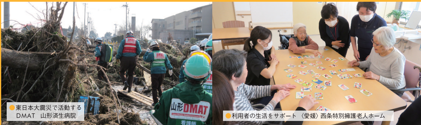
●東日本大震災で活動するDMAT 山形済生病院