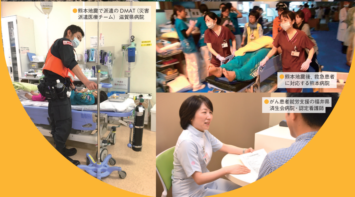
●熊本地震で派遣のDMAT(災害派遣医療チーム) 滋賀県病院