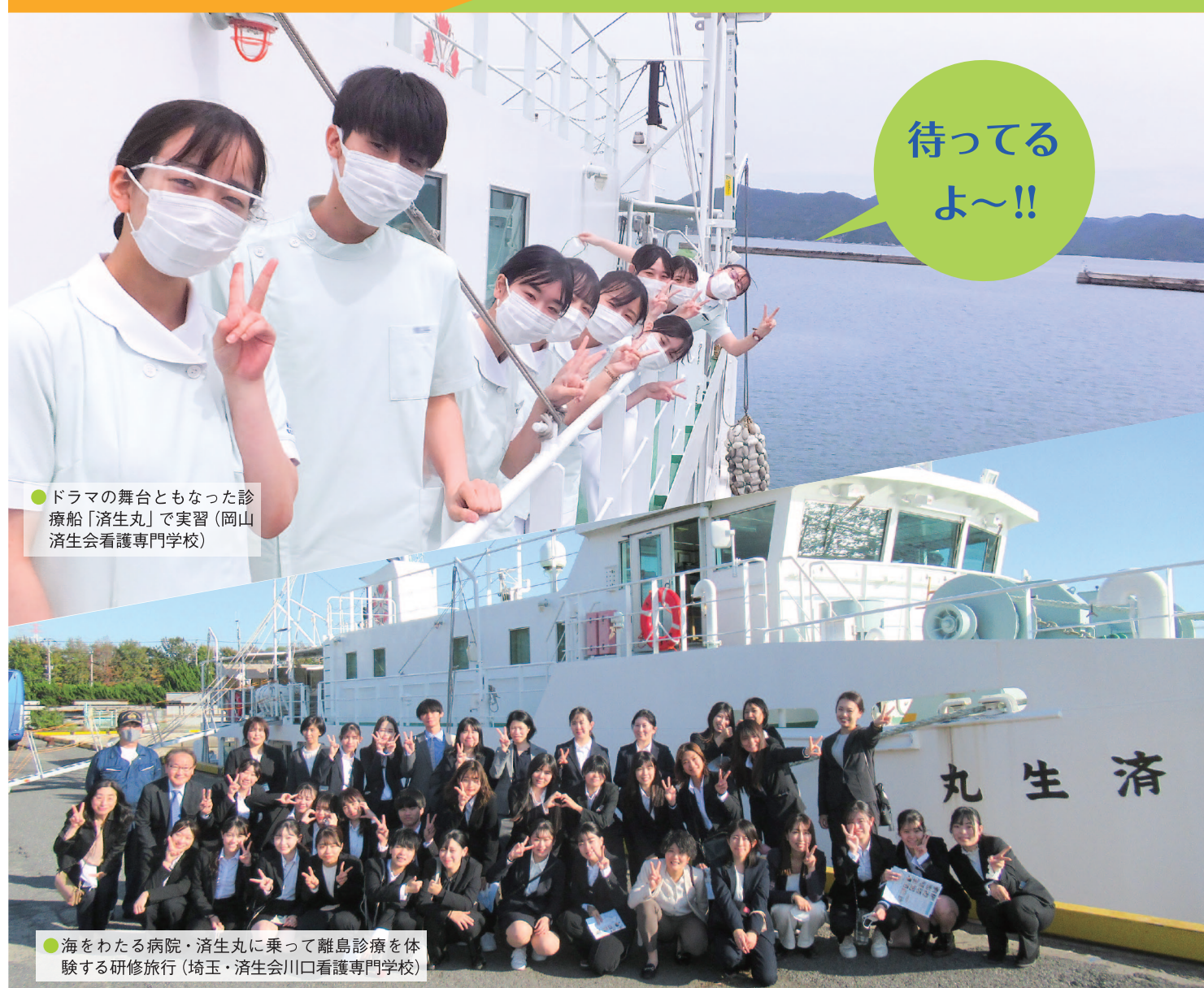
●ドラマの舞台ともなった診療船「済生丸」で実習（岡山済生会看護専門学校）