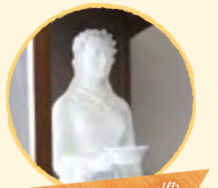
ナイチンゲール像